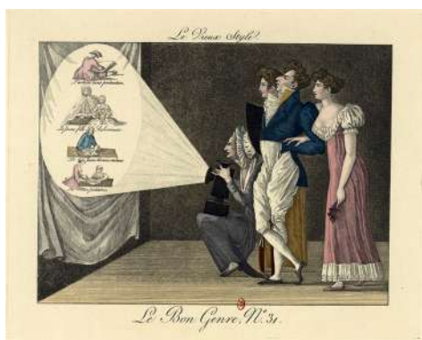
Lanterne magique Caricature dans Le Bon Genre , 1801