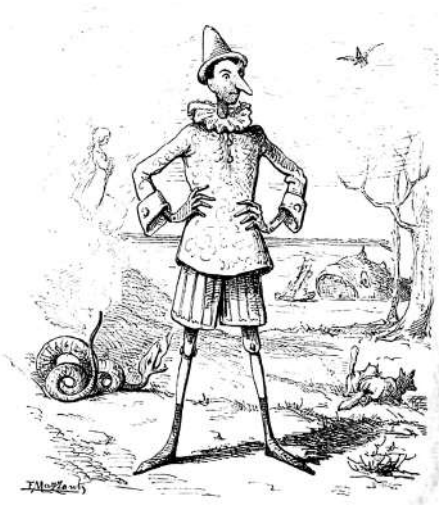
Pinocchio Illustration d'Enrico Mazzanti, 1883