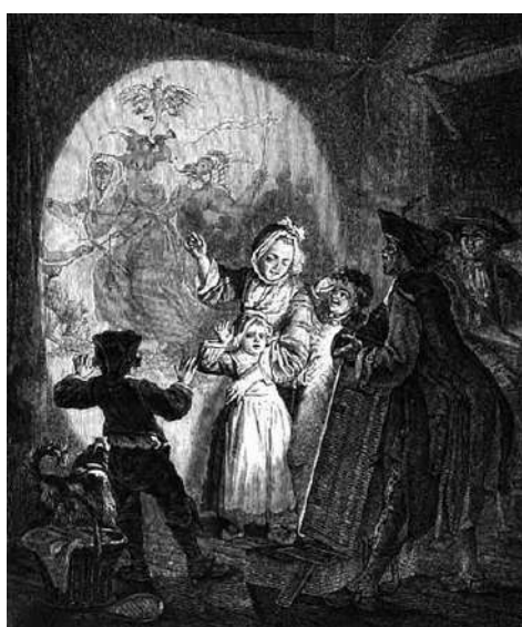
Scène de fantasmagorie à la fin du XVIIIème, gravure de 1885

Il était une fois un pantin de bois nommé Pinocchio qui ne savait pas s'il voulait grandir. Notre dernière création que j'ai adaptée et mise en scène d'après le Pinocchio de Carlo Collodi, conte l'épopée magnifique de l'inusable marionnette. A peine ébauché par son père « qu'il sauta dans la rue et décampa », échappant à son créateur et sa louable morale : Pinocchio le rebelle affronte Pinocchio le petit garçon comme il faut. Pinocchio est un spectacle sur la condition humaine telle que je pense que le théâtre peut la rêver et la dévoiler.